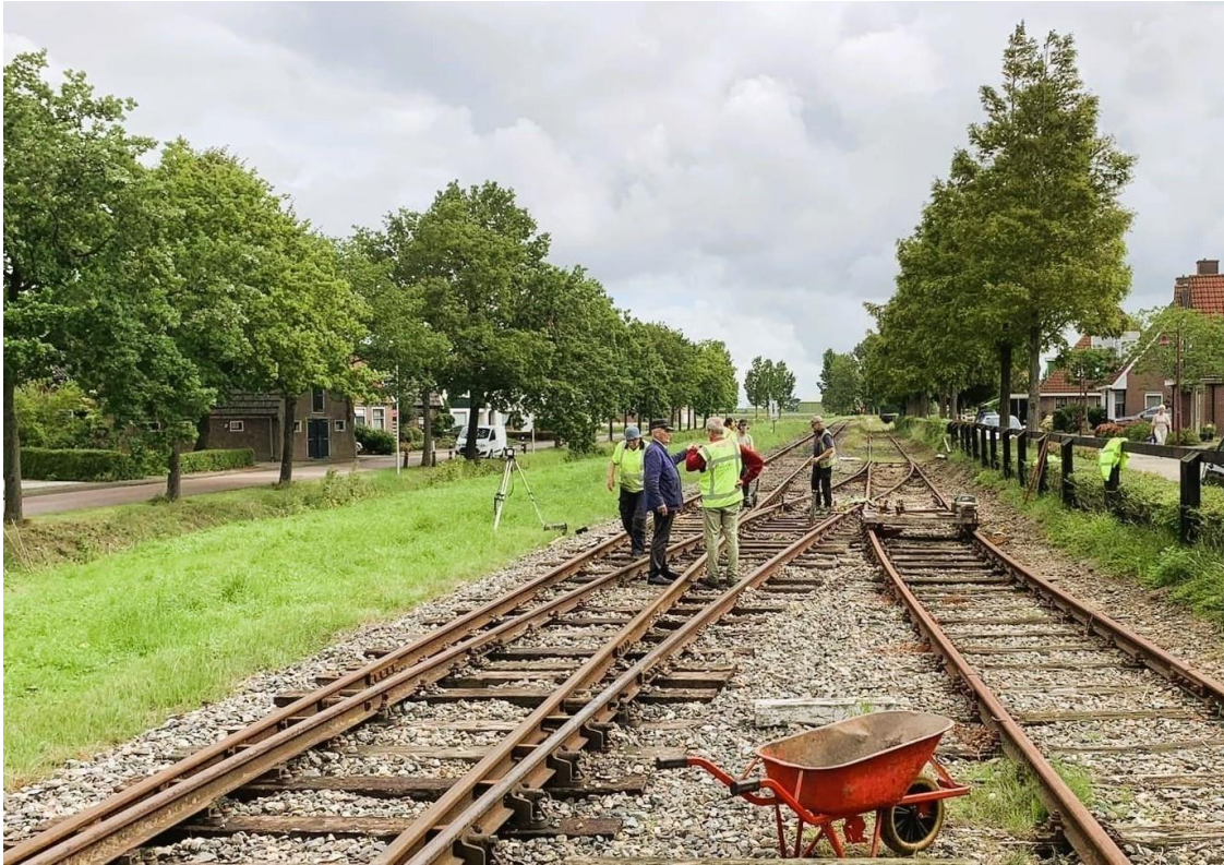
4 augustus 2023: de weg en werken-ploeg onderstept de vernieuwde dwarsliggers onder het wissel naar het zijspoor te Opperdoes.