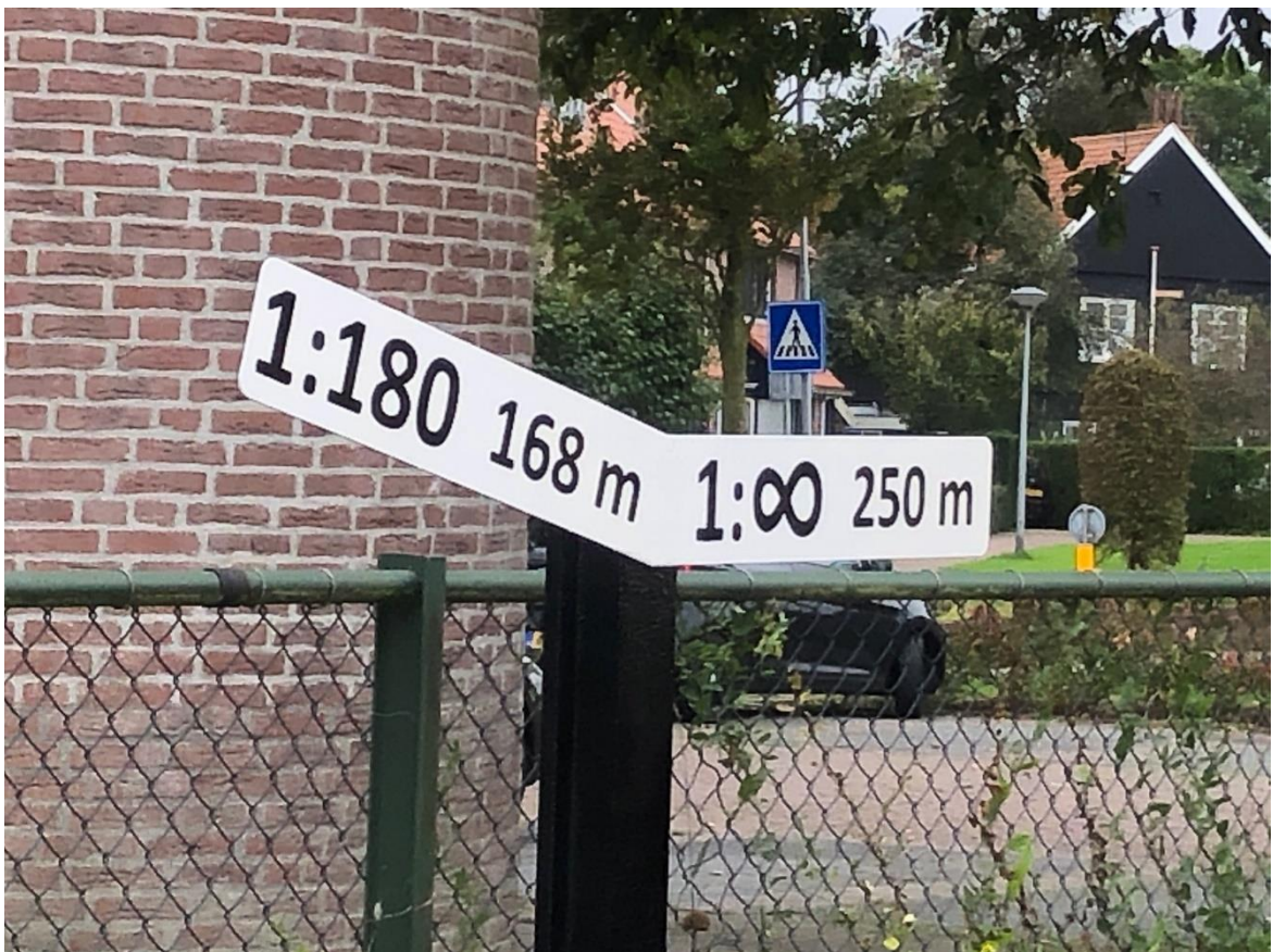
12 oktober 2023: in Medemblik werden twee nieuwe hellingwijzers geplaatst.