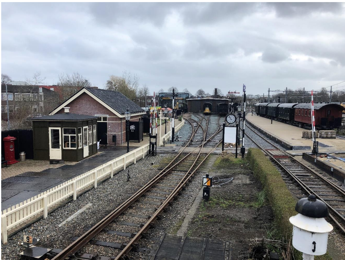
14 maart 2023: er wordt nog volop aan het nieuwe perron gewerkt, maar hoe de toekomst eruit ziet is al wel duidelijk.