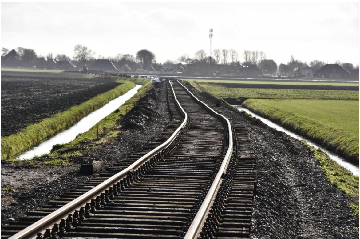
31 januari 2023: het voorlopige resultaat van de spoorvernieuwing, gezien vanaf de overweg in de Poelweg; er moet nog het nodige schift- en stopwerk worden uitgevoerd.