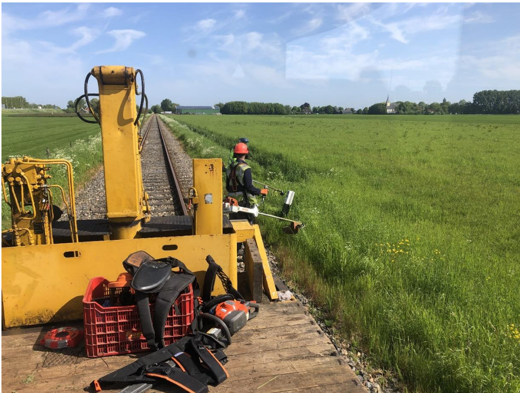
19 mei 2023: de hm-paaltjes langs de 20 km lange spoorlijn worden rondom vrij gemaakt van hoog opschietend gras.