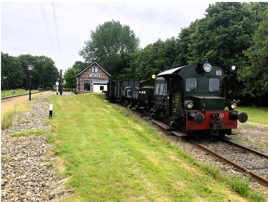
22 juni 2023: de snoeitram is weer op pad. Hier op het zijspoor te Twisk om de boottram te laten passeren.