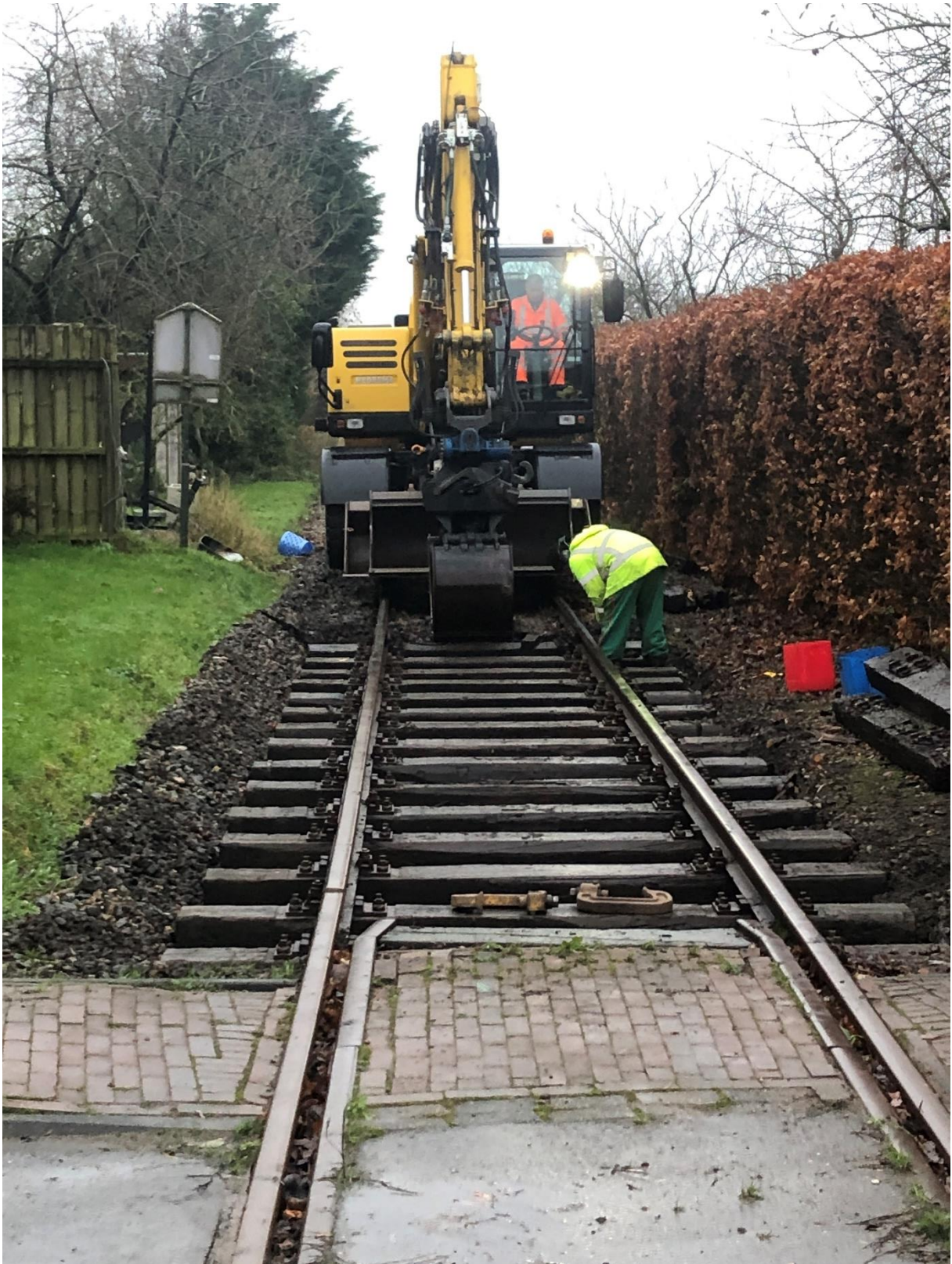
5 december 2023: ook het spoor voor en na de overweg zal vernieuwd worden, terwijl de overweg zelf een nieuwe bevloering zal krijgen.