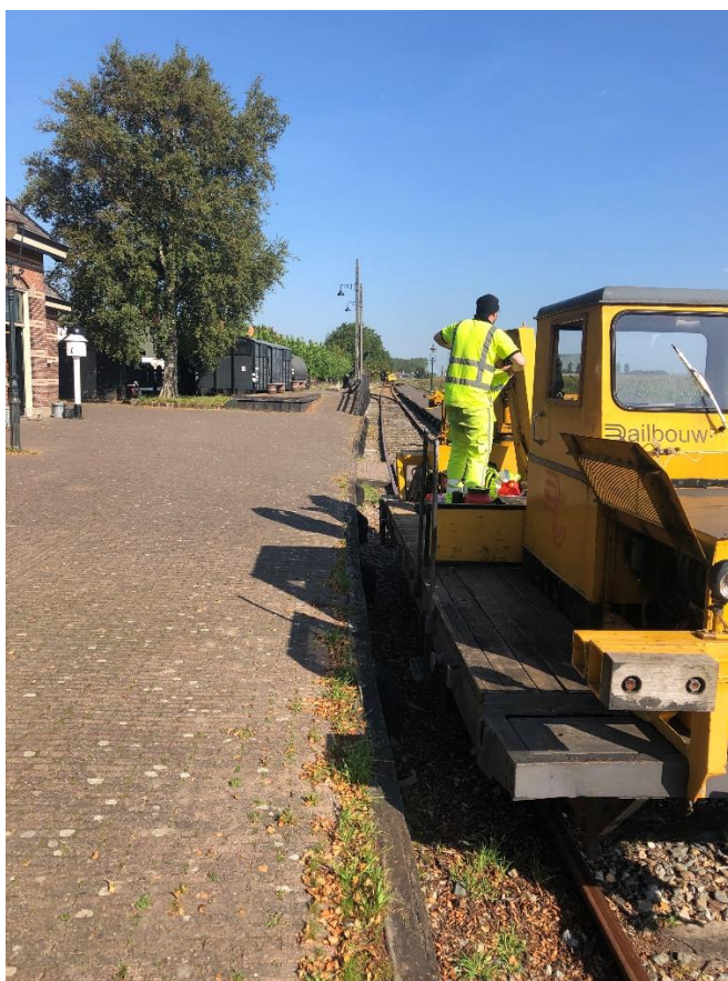
11 september 2023: de strimploeg moest weer op pad om de hm-paaltjes langs de lijn uit het hoog opgeschoten gras te bevrijden. Op de achtergrond wordt gewerkt aan de verlenging van spoor 3.