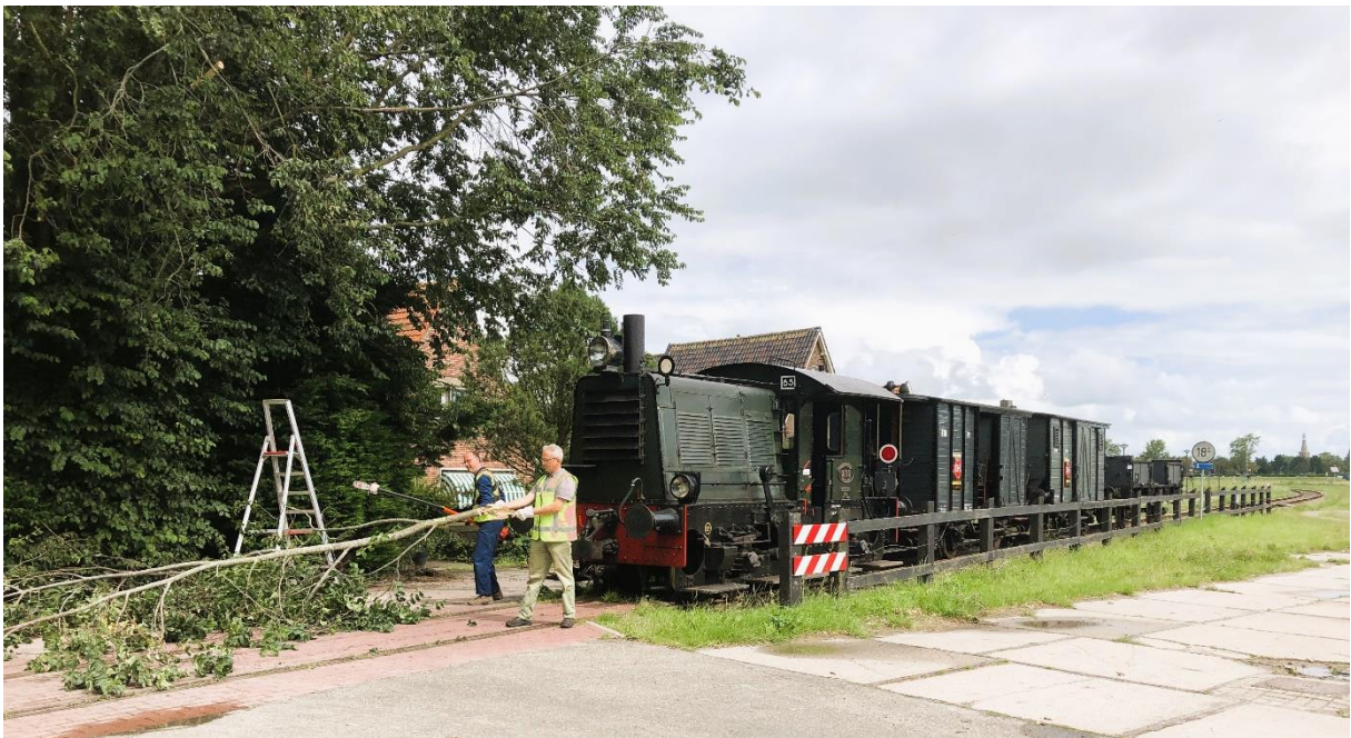
4 augustus 2023: de snoeiploeg aan het werk te Westerblokker en nabij Opperdoes.