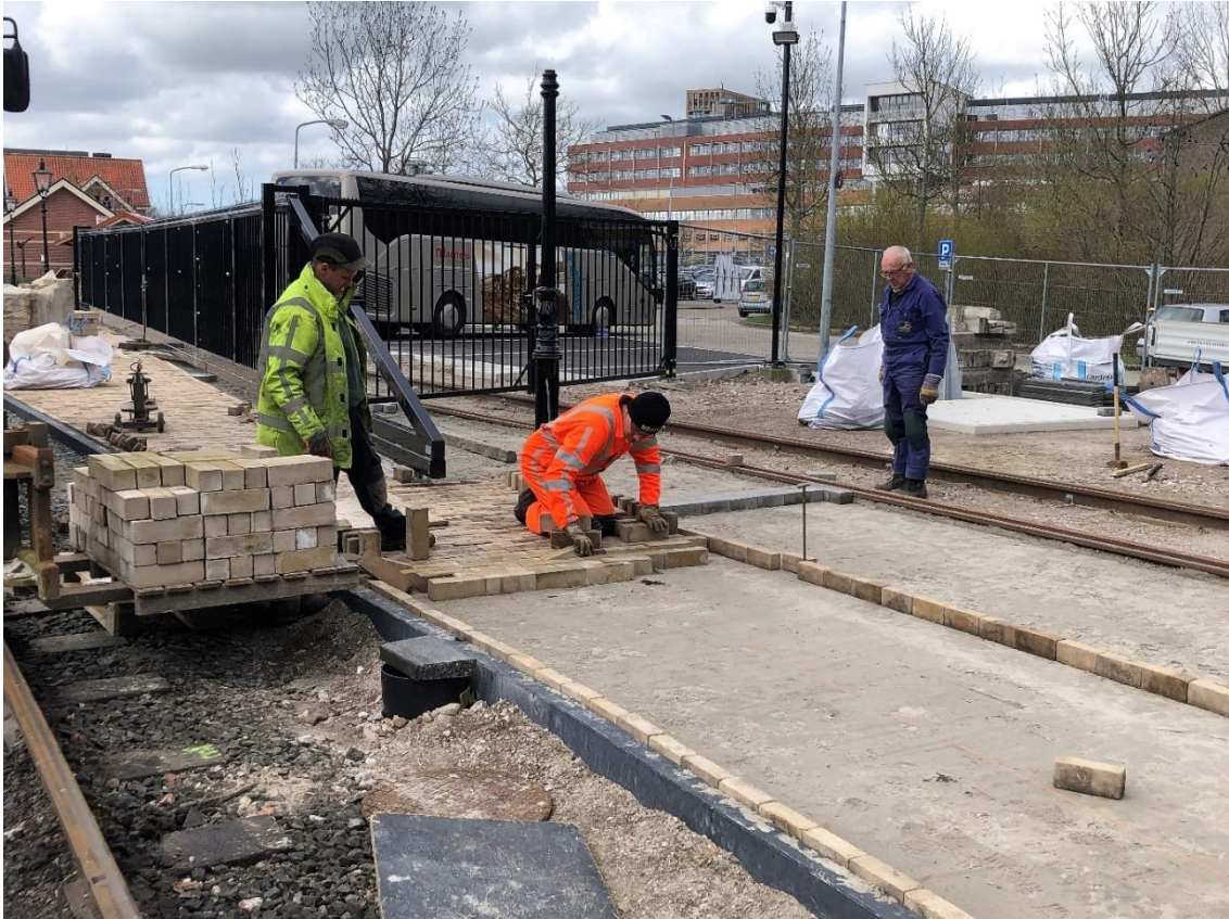
11 april 2023: aanleg van het nieuwe voetpad tussen stationsgebouw en werkplaats / tractiegebouw.