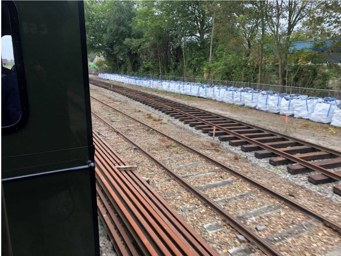
9 oktober 2023: het verlengde spoor 3 te Wognum is gevorderd tot de plek waar het nieuwe wissel zal komen te liggen.