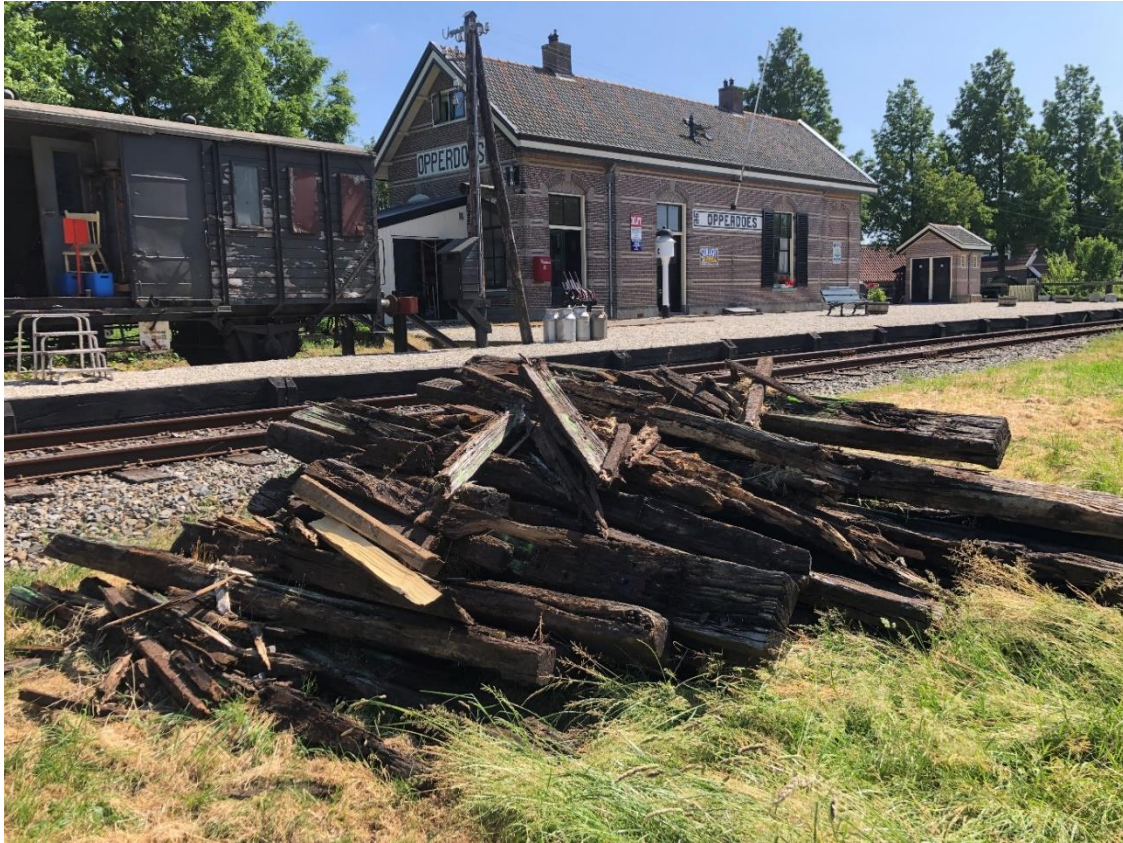
21 juni 2023: aan de oude dwarsliggers is te zien dat ze nodig aan vervanging toe waren.