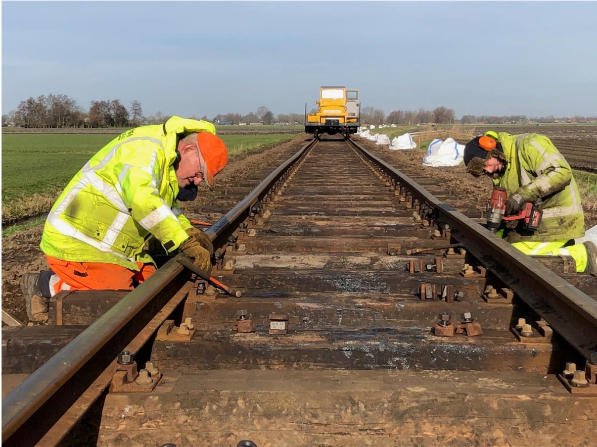
10 februari 2023: de 6232 bevestigingsbouten zijn nog niet allemaal aangebracht, maar het einde komt in zicht.