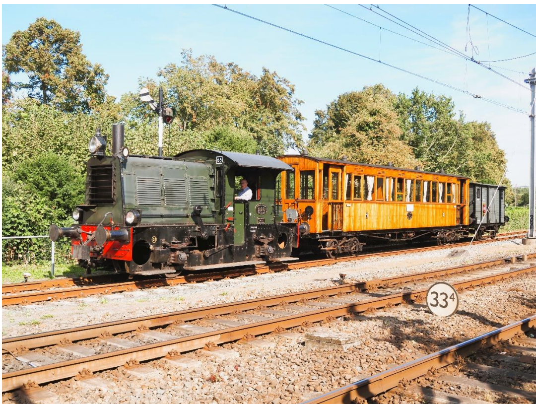
14 september 2023: aankomst der snoeitram in Hoorn.