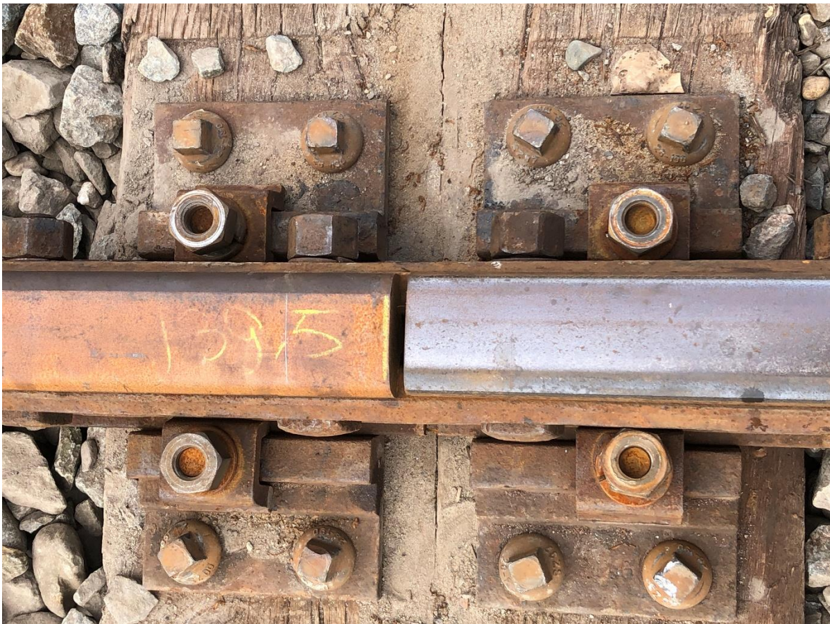
8 mei 2023: nabij Oostwoud worden 2 afgekeurde spoorstaven vervangen door 1 nieuwe. Het railbouwvoertuig met de bijnaam 'kraanvogel' bewees daarbij weer eens zijn praktisch nut.