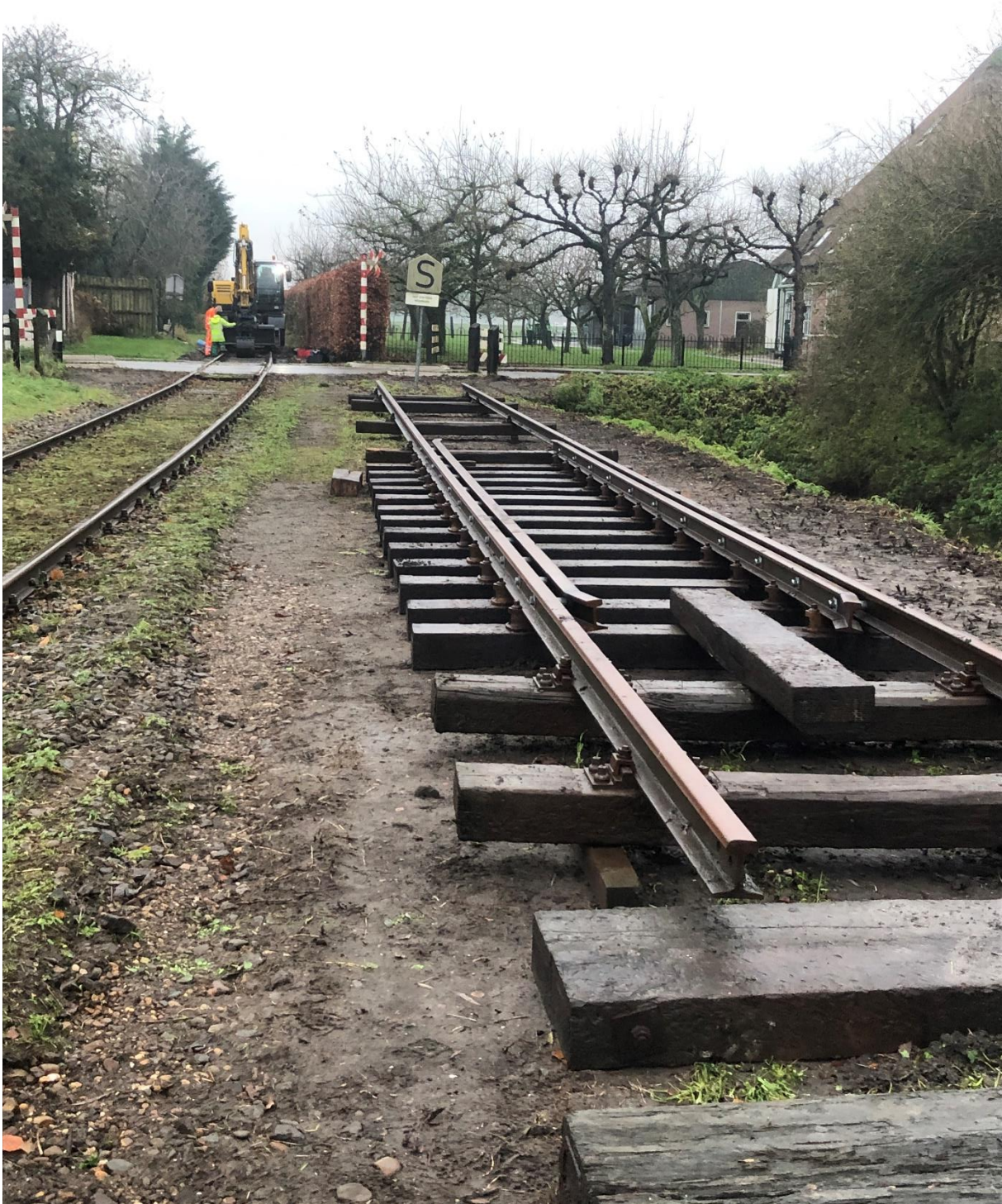
5 december 2023: nee, bij station Benningbroek wordt geen omloopspoor aangelegd. Wat we hier zien is het nieuwe spoor voor de overweg, die binnenkort geheel vernieuwd zal worden.