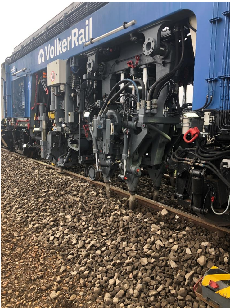
21 maart 2023: om het nieuw gelegde spoor recht en strak te maken is de stop- en schiftmachine aan het werk.