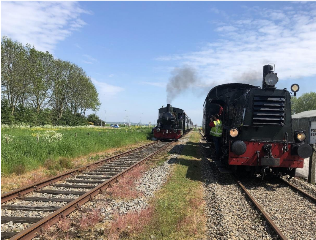
12 mei 2023: de op het zijspoor te Midwoud-Oostwoud staande snoeitram wordt ingehaald door de uit Medemblik terugkerende boottram.