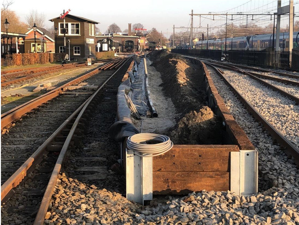
Het eind van het nieuwe perron, aan de zijde van de Lange Loods. Links spoor 9, rechts spoor 7 dat via een nieuw wissel aansluit op het restant van spoor 8 (en van daar weer op 9, via het wissel links.)