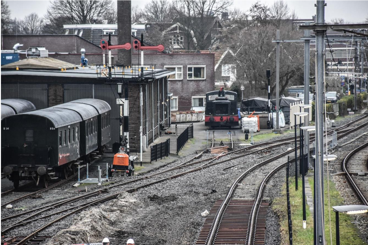
23 januari 2023: op deze met een telelens genomen foto is goed te zien dat spoor K nog een klein stukje moet worden omgeschift om op het nieuwe wissel 10 aan te kunnen sluiten.