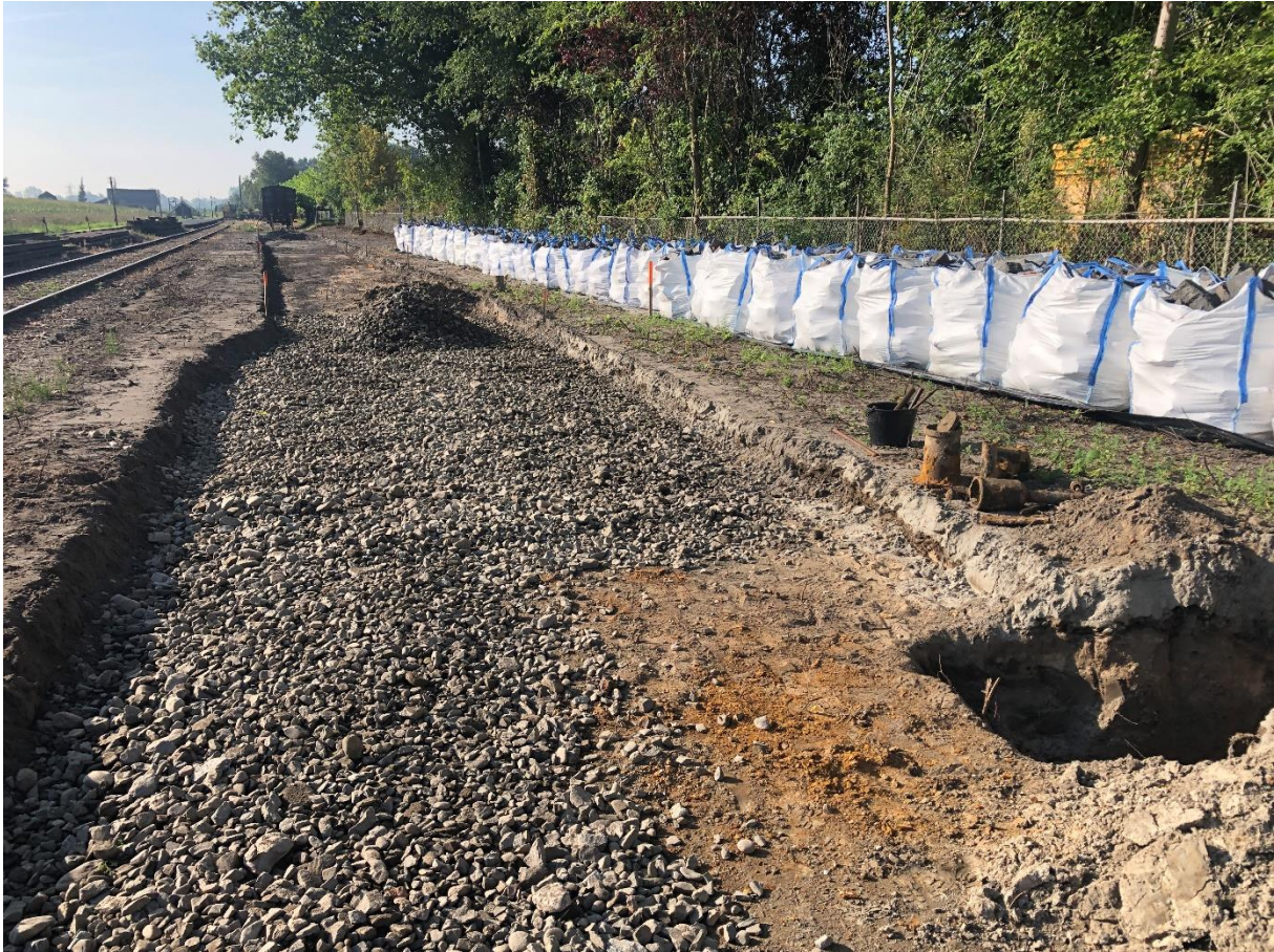
11 september 2023: tijdens werkzaamheden voor de verlenging van spoor 3 te Wognum werden de restanten ontdekt van de waterkolom en de aansluiting naar de watertoren, die hier hebben gestaan ten behoeve van de tramlijn uit Schagen.