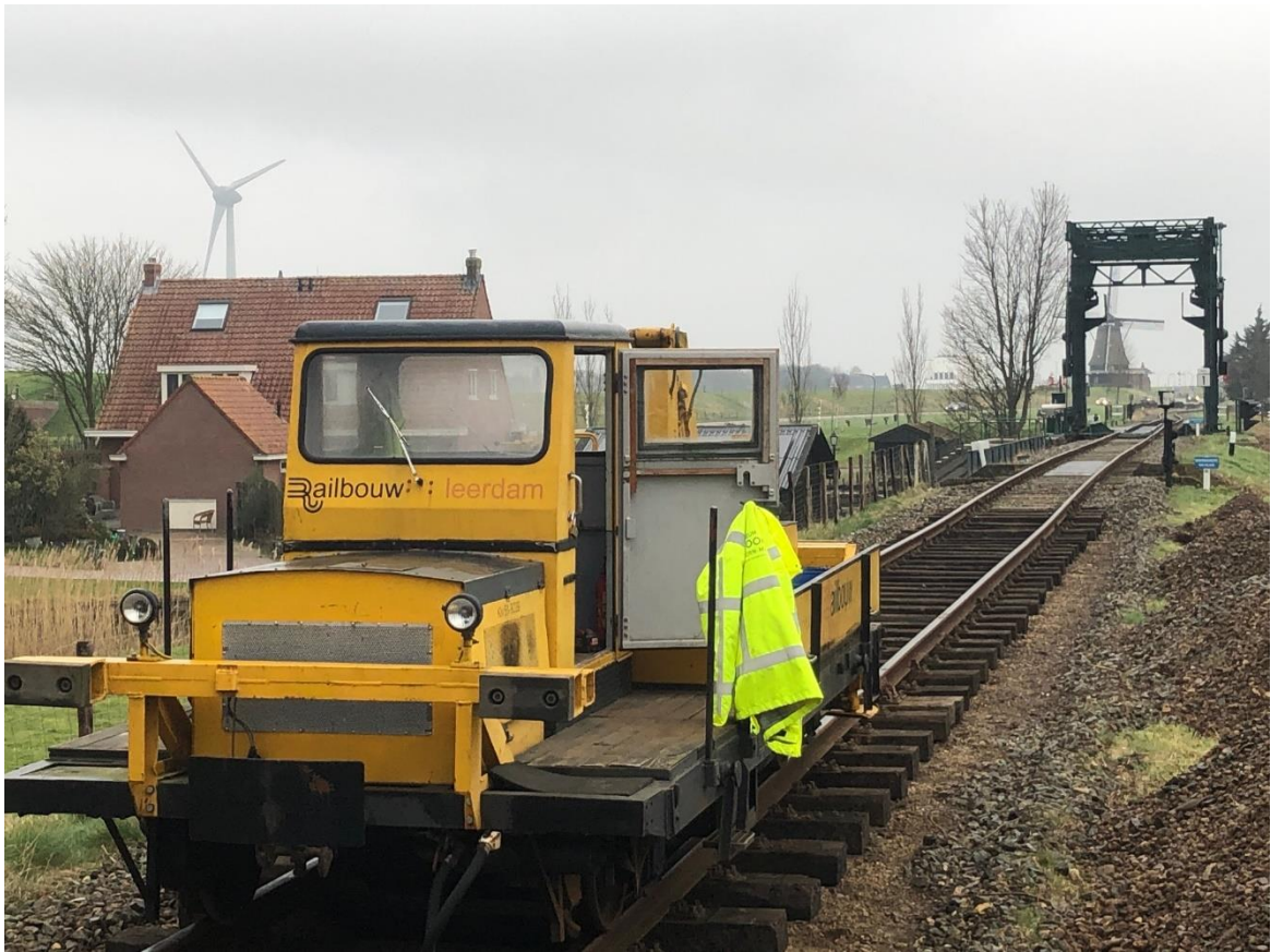
21 februari 2023: nu de spoorvernieuwing tussen Oostwoud en Twisk nagenoeg klaar is, wordt ook nog 'even' een paar honderd meter spoor aangepakt nabij Medemblik.