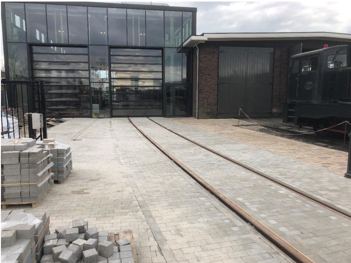
20 april 2023: het plein voor de nieuwe werkplaats is gereed v.w.b. spoor 4. Nu spoor 5 nog !