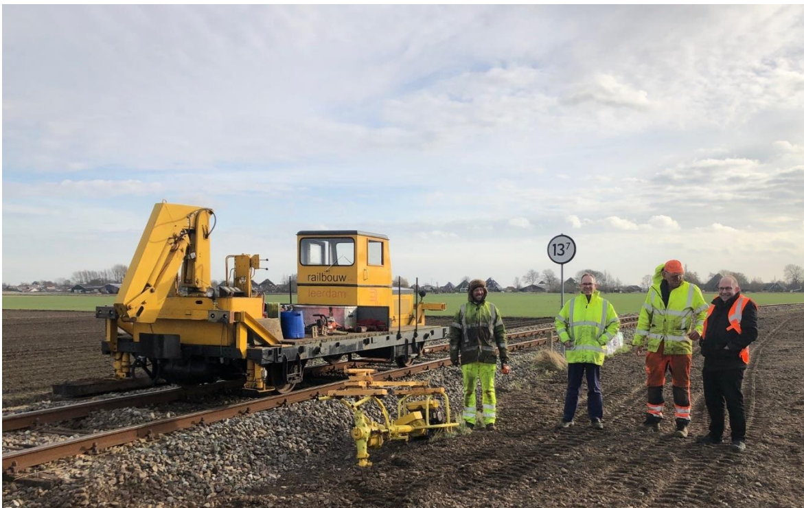
10 februari 2023: de voltallige directie van de Museumstoomtram komt zich van de voortgang der werkzaamheden op de hoogte stellen.