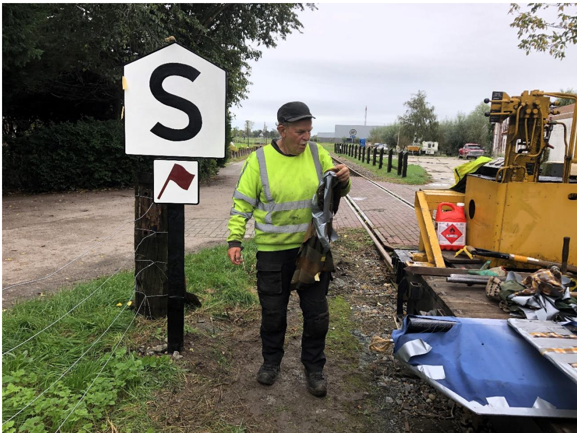
12 oktober 2023: nabij de zuurkoolfabriek in Opperdoes werden twee nieuwe S-borden geplaatst.