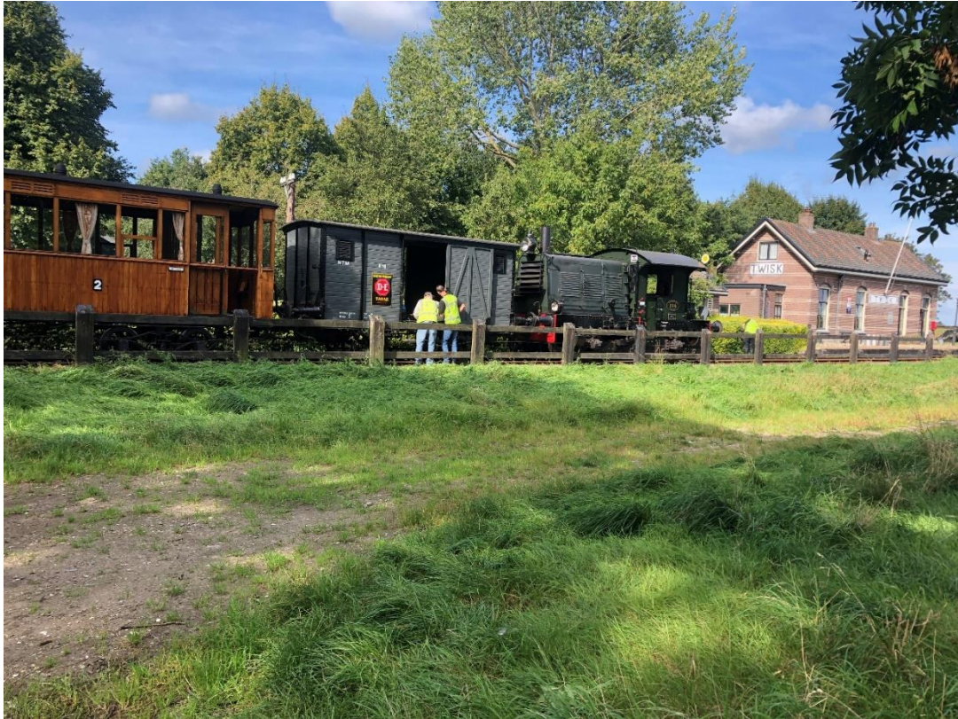
14 september 2023: de snoeitram is weer op pad en houdt hier halt te Twisk, om de heg langs het perron te knippen.