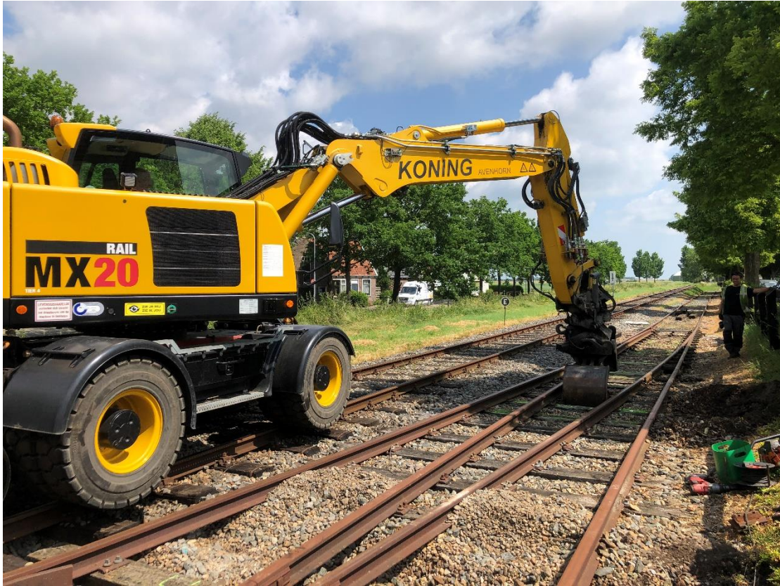
21 juni 2023: van twee wissels op het emplacement Opperdoes worden dwarsliggers vernieuwd.