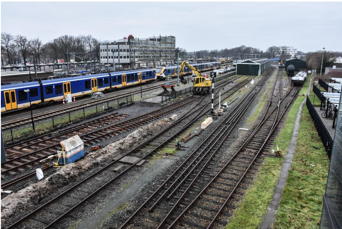
Bij de lange loods is nu te zien hoe spoor 8A is aangesloten op spoor 7. In spoor 7 is een wissel aangebracht dat in de linksleidende stand tegen het stootjuk eindigt dat daar al stond; daarmee wordt de mogelijkheid opgehouden om in de toekomst het spoor evt. te kunnen verlengen tot naast de lange loods.