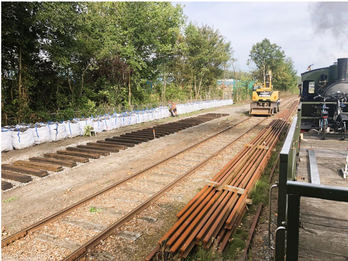
26 september 2023: overzicht van de verlenging van spoor 3 te Wognum.