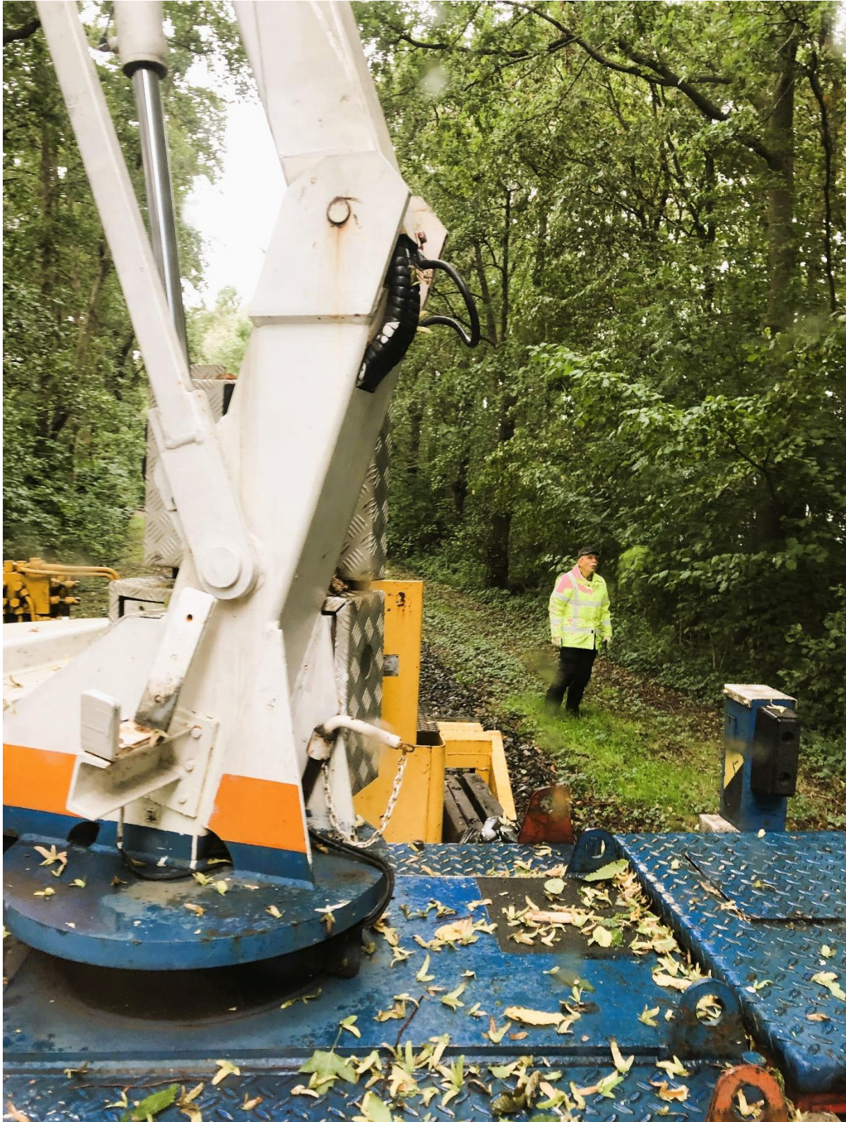
3 oktober 2023: in het Zwaagse Bos wordt weer gesnoeid, om er zeker van te zijn dat de boomtakken buiten het profiel van vrije ruimte blijven. Omdat de machinist van de 'kraanvogel' geen zichtcontact heeft met de man in het bakje van de hoogwerker, zorgt een veiligheidsman op de grond voor de communicatie tussen die twee.