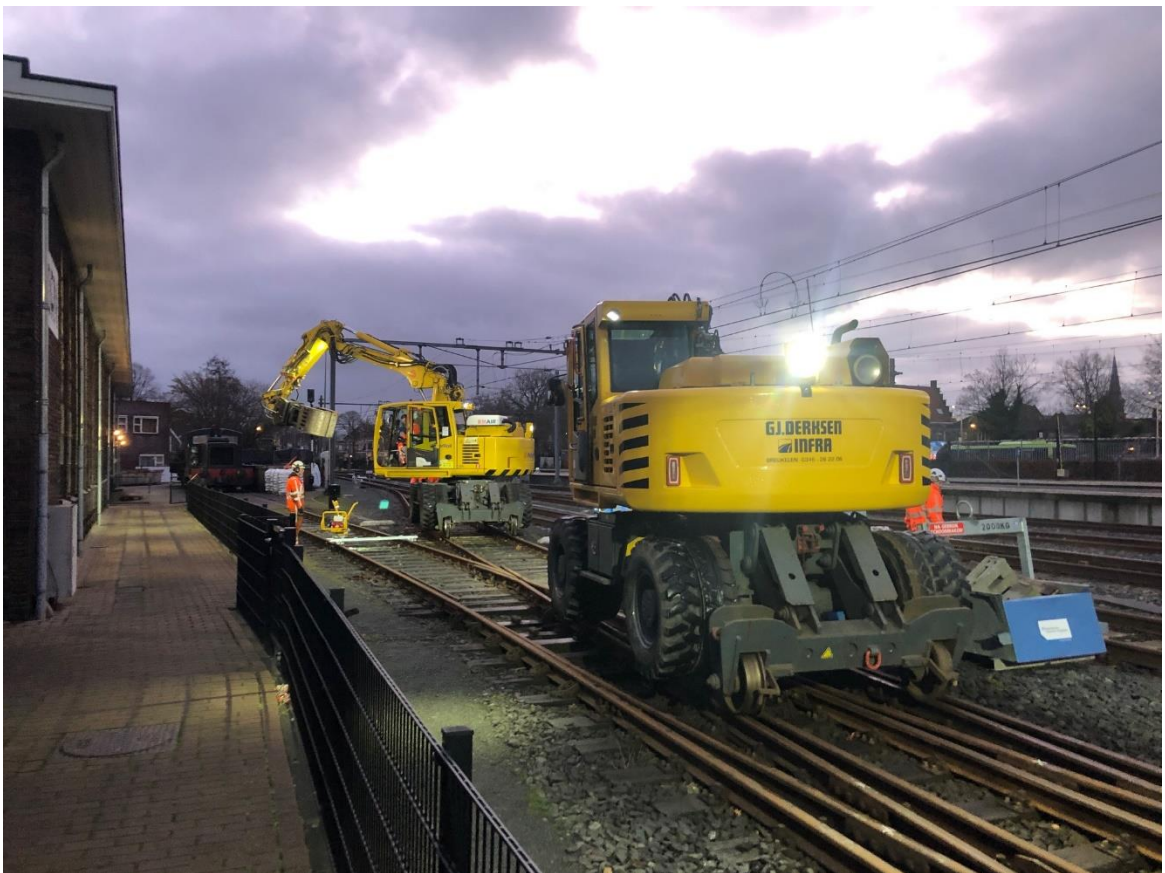
10 januari 2023: al vroeg in de ochtend zijn de mannen van Volker Rail begonnen met het demonteren van 'de engelsman' op het emplacement Hoorn.