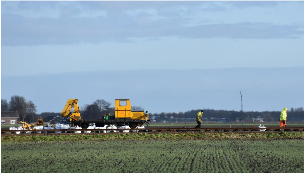
31 januari 2023: vernieuwing spoorbaan tussen Poelweg en station Midwoud-Oostwoud. Roelof van der Molen en Dick Binkhorst zijn met de Klv 51 vanaf Twisk naar de werkplek gereden.