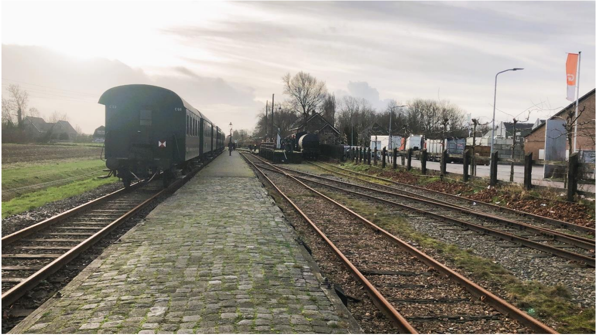
29 december 2023: overzicht van de werkzaamheden rond spoor 3 op het station van Wognum – Nibbixwoud.