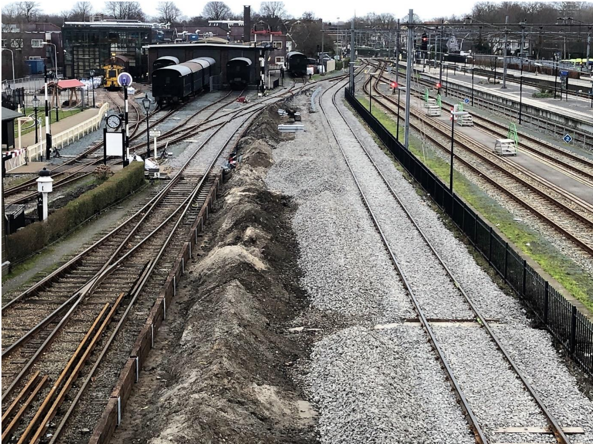
3 februari 2023: de nieuwe sporensituatie in Hoorn is gereed en het nieuwe perron begint vorm te krijgen.