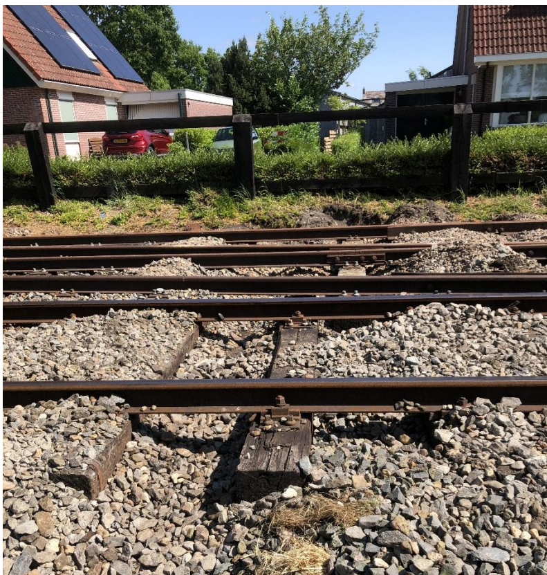
Met behulp van een kraan worden de slechte exemplaren onder de rails uit getrokken, waarna nieuwe exemplaren ervoor in de plaats komen.