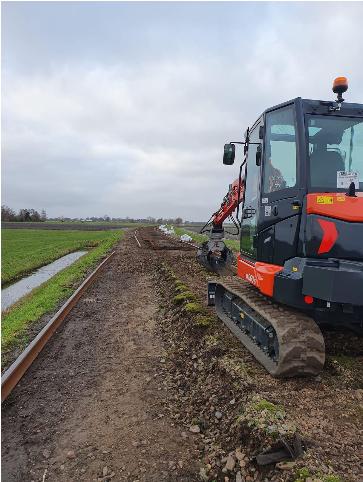
26 januari 2023: behalve in Hoorn wordt ook hard doorgewerkt tussen Twisk en Oostwoud. Rails en bevestigingsmateriaal losmaken en verwijderen, oude bielzen eruit ...