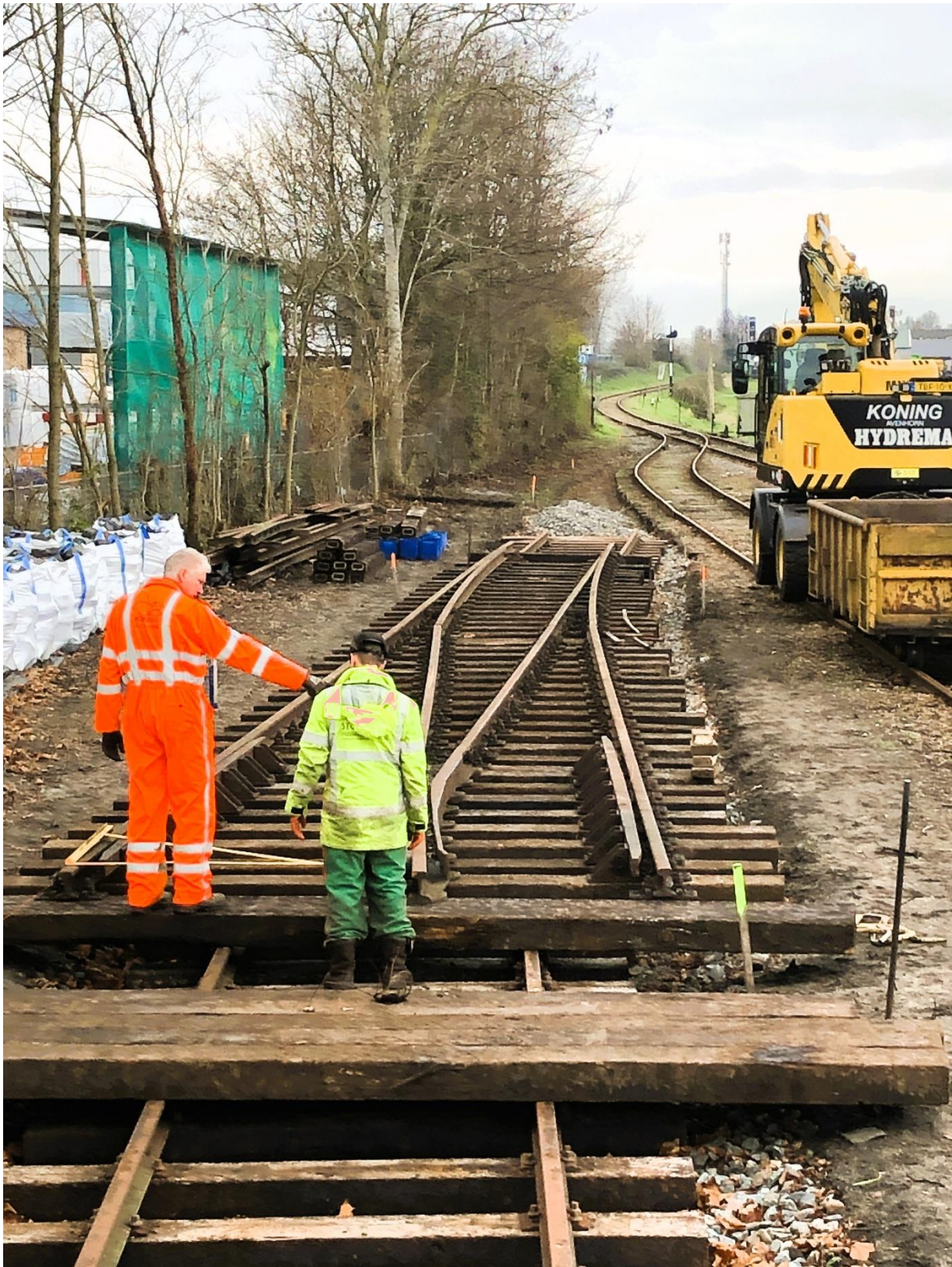
14 december 2023: de bouw van het nieuwe wissel, waarmee spoor 3 te Wognum zal worden aangesloten op spoor 2.