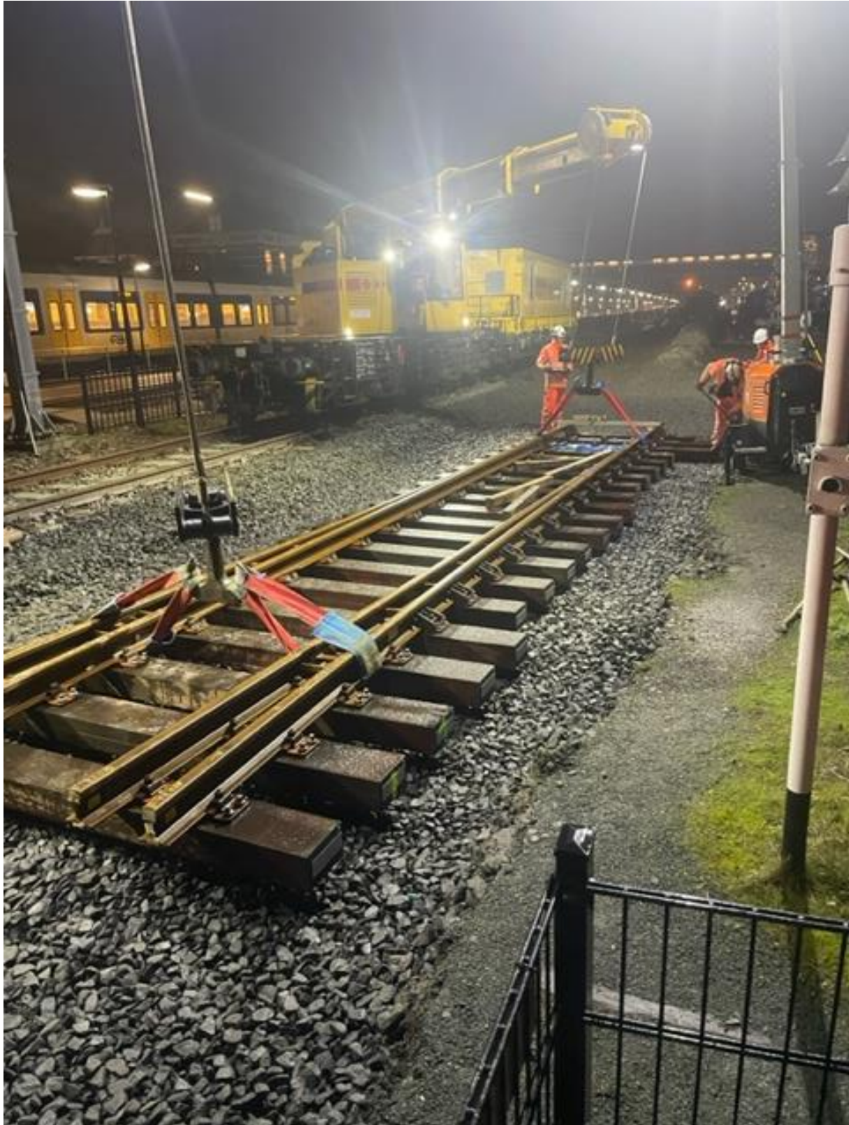
20 januari 2023: om 8 uur werd begonnen met het leggen van het wissel, dat op de plaats komt van de 'engelsman'...