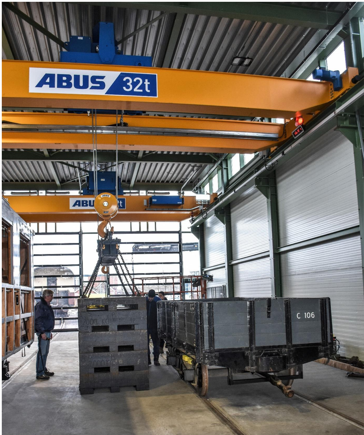
31 januari 2023: proefbelasting van de bovenloopkranen met een gewicht van ruim 36 ton per kraan.